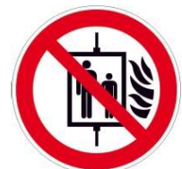
Aufzug im Brandfall nicht benutzen

BAVARIA Brandschutz Industrie GmbH & Co. KG Regensburger Str. 16 D-93449 Waldmünchen Tel.: +49(0)9972 9401-0