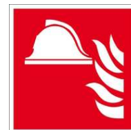
Mittel u. Geräte zur Brandbekämpfung